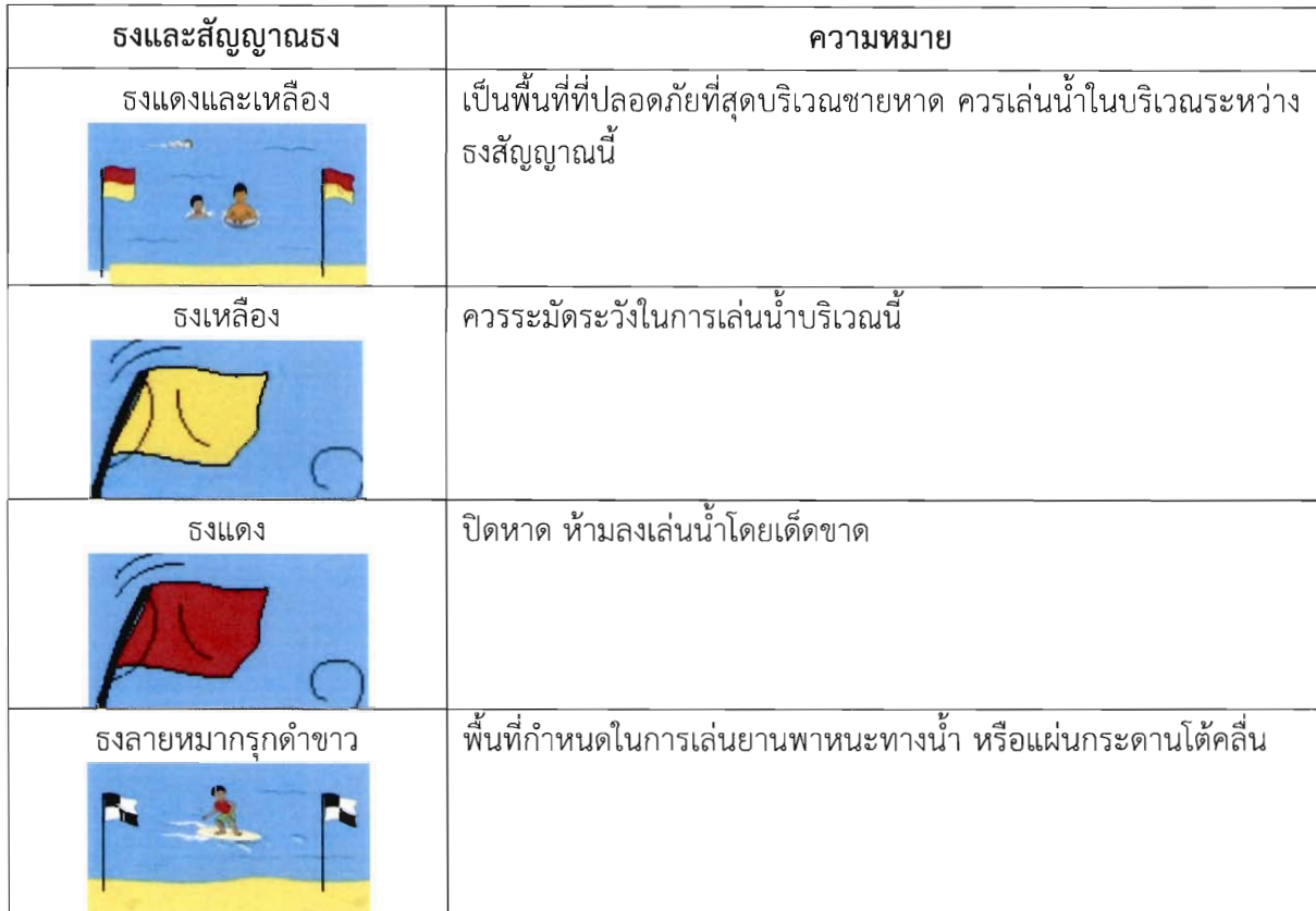
ตารางที่ 2 ความหมายของธงและสัญญาณธง